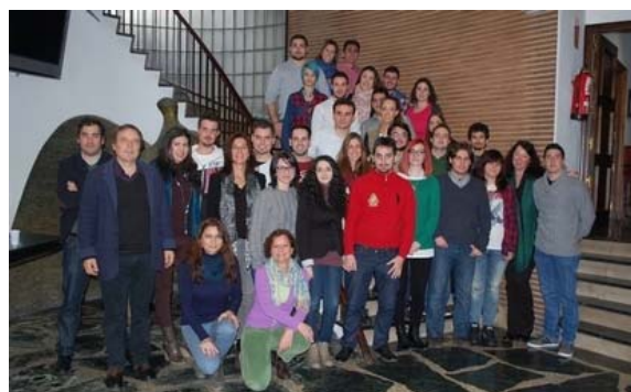
Alumnos seleccionados para irse a Alemania.

El próximo 16 de febrero comienzan en la sede cameral el curso de alemán.